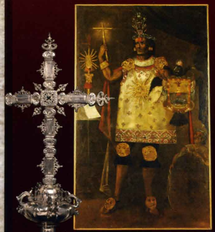
1 (アリババ) 15世紀中頃~1532年 ラルコ博物館 2 (チュニック) 15世紀中頃~1532年 ベルー文化舎・ペルー国立考古人類学歴史学博物館 3 (眼球が残る20代女性のミラ) 15~16世紀 レイマンバ博物館 4 (ミラ包み) 15~16世紀 レイマンバ博物館 5 (銀製十字架(部分)) 17世紀 オズマ博物館 6 (アロンソ・チワン・インガの肖像画) 18世紀 ペルー国立クスコ大学インカ博物館