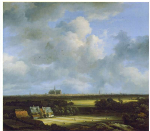
(上段左端から) ヨハネス・フェルメール「ディアナとニンフたち」 レンブラント・ファン・レイン「自画像」/「羽根飾りのついた帽子をかぶる男のトロニー」 フランス・ハルス「笑う少年」(下段左端から) ペーテル・パウル・ルーベンス「聖母被昇天(下絵)」/「ミハエル・オフォヴィウスの肖像」 ヤン・ブリューゲル(父)「万層架付の花瓶に生けた花」 ヤーコブ・ファン・ライスダール「漂白場のあるハールレムの風景」