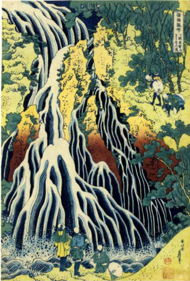
「諸国瀧廻り 下野黒髪山きりふりの滝」 天保4年(1833)頃 William Sturgis Bigelow Collection