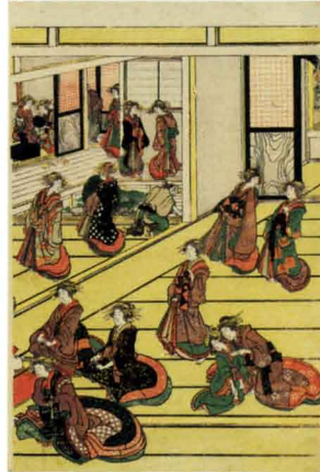
「吉原遊廓の景」(部分) 文化8年(1811)か