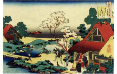
「百人一首うはかゑるとき 小野の小町」 天保6年(1835)頃 William Sturgis Bigelow Collection