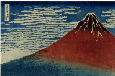
「富嶽三十六景 凱風快晴」 天保2年(1831)前後 Nellie Parney Carter Collection - Bequest of Nellie Parney Carter