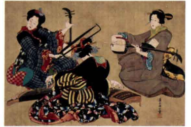
葛飾応為「三曲合奏図」 弘化年間(1844-48)頃 William Sturgis Bigelow Collection