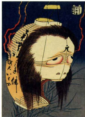
「百物語 お岩さん」 天保2-3年(1831-32)頃 William Sturgis Bigelow Collection