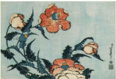
「芥子」 天保4-5年(1833-34)頃 William Sturgis Bigelow Collection