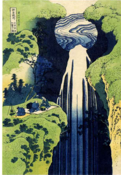
「諸国瀧廻り 木曾路ノ奥阿弥陀ヶ瀧」 天保4年(1833)頃